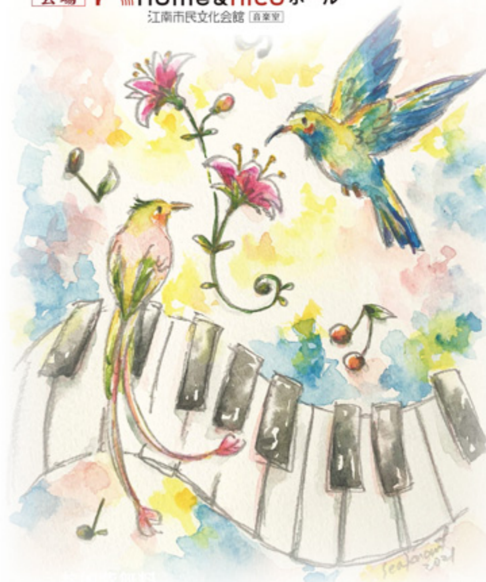
イラスト:むらかみしの